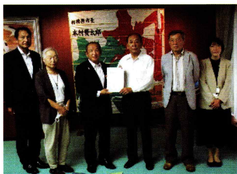
左から森副市長、倉橋さん、本村市長、竹田会長、山本さん、事務局