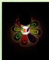
地球温暖化防止さがぼーくんかるた