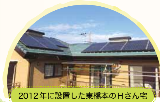
2012年に設置した東橋本のHさん宅