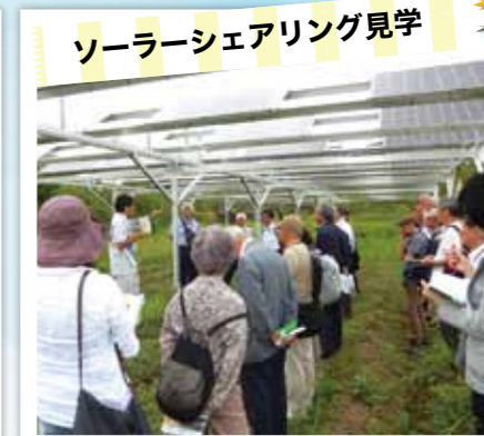
ソーラーシェアリング見学