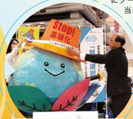
さがぼーくん委嘱式