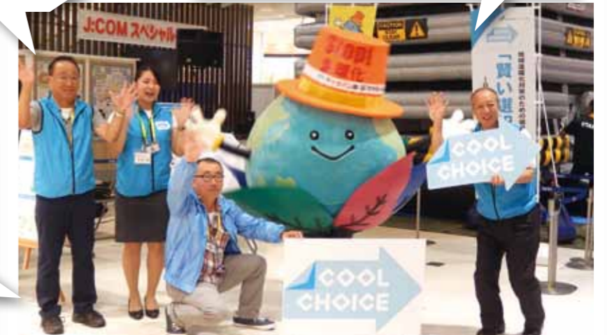
今年度 地球温暖化対策のための国民運動「COOL CHOICE」の啓発活動を行うさがぼー隊長とCOOL CHOICEキャラバン隊

相模原市は、市域における温室効果ガス排出量削減を目指し、平成30年1月に「COOL CHOICE」への賛同を宣言しているよ。「さがみはら地球温暖化対策協議会」は相模原市と連携しながら、さらなる地球温暖化対策に取り組んでいるんだよ。