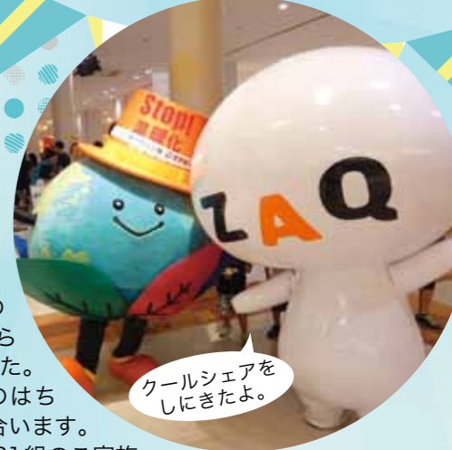
クールシェアをしにきたよ。