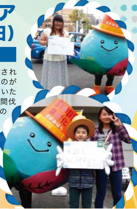
さがぼーくとクールチョイス宣言

当日は、イベントの開始に合わせ、さがぼーくんのキャラバン隊長委嘱式を行い、相模原市からさがぼーくんへ隊長のはちまきが贈呈されました。さがぼーくんの頭の大きさに合わせて普通のはちまきの3倍の長さの特別製で、とてもよく似合います。「さがぼーくとクールチョイス宣言」には、21組のご家族が参加。素敵な宣言をしてくださいました。パネルなどの展示にも興味を持っていただき、地球温暖化対策について良いアピールができたと思います。同会場では、テラノサウルスのふわふわ滑り台や、恐竜骨格3Dパズル工作も行われ、小学生以下の子どもたちがたくさん集まってとても賑やかなクールシェアイベントとなりました。なお、キャラバン隊は今年度、さまざまなイベントで地球温暖化対策のための国民運動「COOL CHOICE」をよびかけます。