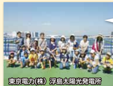
東京電力(株) 浮島太陽光発電所

天然ガス(LGN)は-162度に冷却・液化されて海外からタンカーで運ばれてきます。-162度の実験でカーネーションがぱりぱりに凍りました！