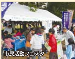
市民活動フェスタ