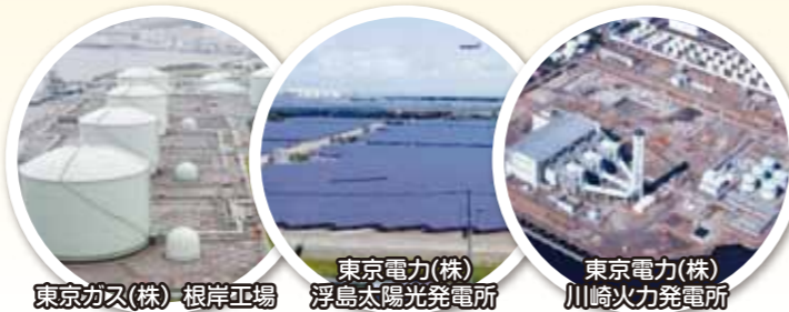
東京ガス(株) 根岸工場

小学4年生以上のご家族9組20名で、省エネに取り組む工場、発電所と再生可能エネルギーの発電所を見学しました。見学先は「東京ガス(株)根岸工場」「東京電力(株)浮島太陽光発電所(メガソーラー)」「東京電力(株)川崎火力発電所」の3か所です。最新の技術を導入した工場や発電所は二酸化炭素の排出量も削減し、地球温暖化防止につながっています。ふだん何気なく使っているガスや電気を作っている現場を間近に見て、参加した皆さんからは「いつも見れない所が見れてすごかったのしかったです。」「こういう体験をしたから自分にもできる小さなことから協力していきたい。」「1人1人のちょっとした注意で省エネを心がけていかなければいけないと思いました。」といった感想が寄せられました。