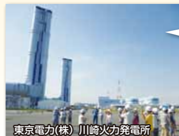
東京電力(株) 川崎火力発電所

浮島太陽光発電所は出力7,000kW、年間発電量は一般家庭約2100軒分の年間使用電力量に相当します。かわさきエコ暮らし未来館の屋上から一望できます。