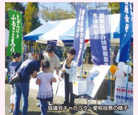
協議会キャラクター愛称投票の様子

多くの皆様に応募、投票をしていただき、名前は「さがぼーくん」に決まりました。ご協力ありがとうございました。詳しくは1面をご覧ください。