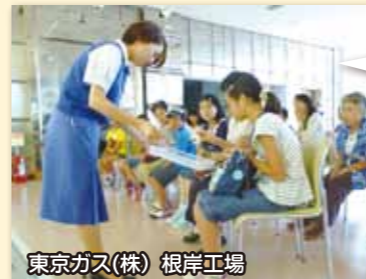
東京ガス(株) 根岸工場

天然ガス(LGN)は-162度に冷却・液化されて海外からタンカーで運ばれてきます。-162度の実験でカーネーションがぱりぱりに凍りました！